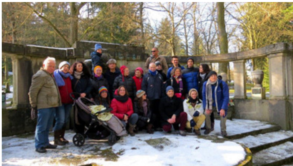
המשפחה המורחבת באחוות הקבר של משפחת לאי

במהלך 2 ימי השהות שלנו בפלאון ערכנו ביקור בבית הקברות היהודי בעיר וזכינו לשמוע סקירה מפי היסטוריונית מקומית. ביקרנו באחוות הקבר של המשפחה (הממוקמת בבית הקברות הכללי של העיר), הינו בסיור במוזיאון התחרה, שם שמור מקום של כבוד למפעל המשפחתי של האחים לאי שתוצרתו נמכרה בעבר בחניות יוקרה בברלין, לונדון ופריז.