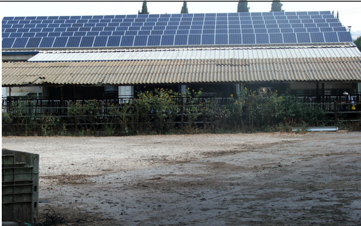
מערכת סולארית על גג המוסך