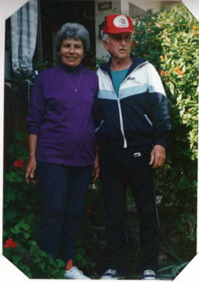
ג'מיתיה ואשר סמא ינואר 1997