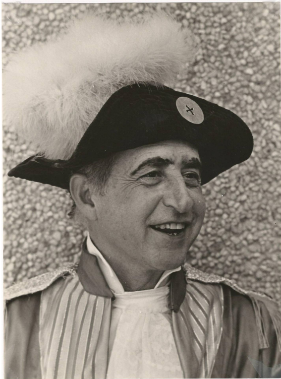
1981 חתול במגפיים