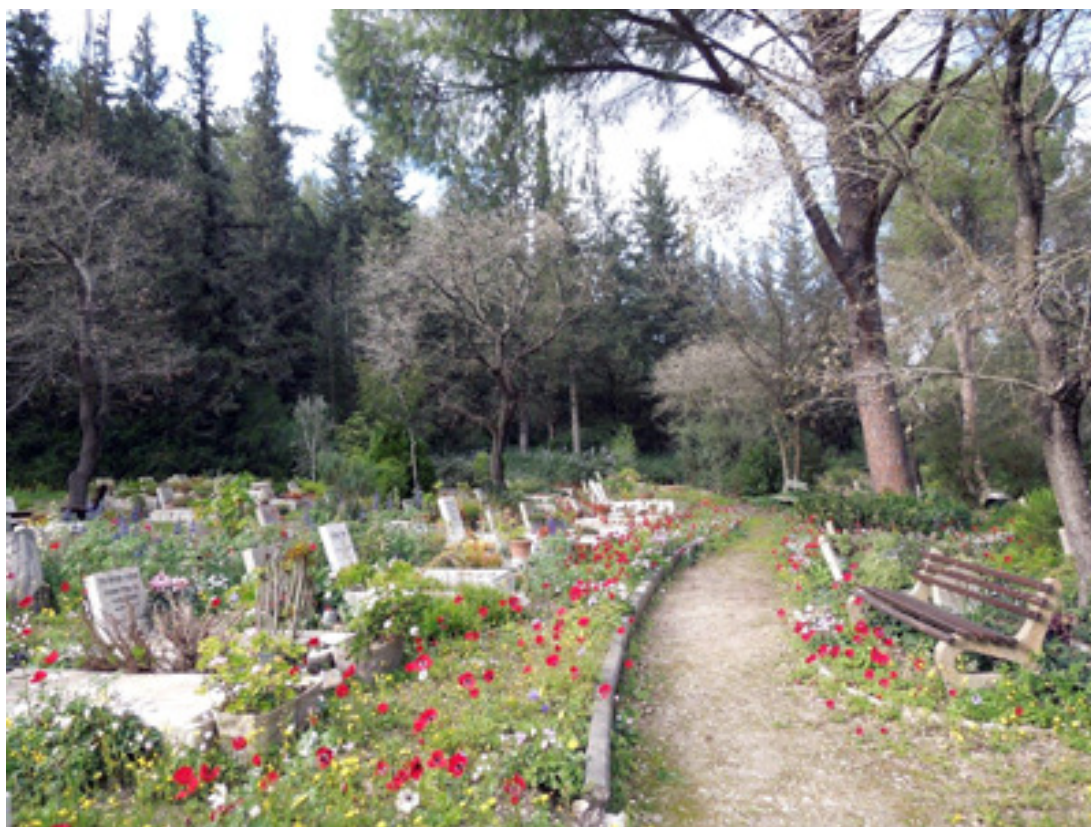
בבית הקברות פברואר 2013