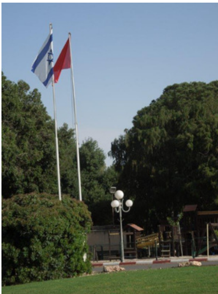
הזרע ה-1 במאי 2016