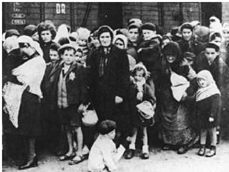
קבוצת יהודים מהונגריה ברציף הרכבת של מחנה אושוויץ קיץ, 1944

*אלי ויזל נולד ב-30.9.1928, בסיגט שברומניה שסופחה ב-1940 להונגריה, בת בריתה של גרמניה הנאצית. אפריל 44, פלש הצבא הגרמני להונגריה והיהודים גורשו לאושוויץ, ביניהם ויזל ומשפחתו. ויזל היה עיתונאי, פילוסוף, סופר, חתן פרס נובל לשלום שעסק בהנצחת זכר השואה.