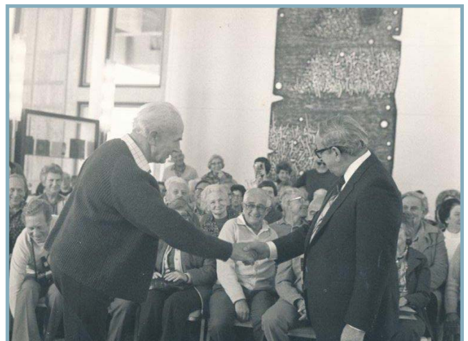
ביקור הוותיקים אצל הנשיא נבון 1981