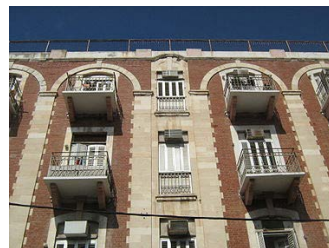
בית סורסוק בתל אביב

הרעיון להקים מסילת ברזל מחיפה עד עבר הירדן, קדם בעשרות שנים למסילה החיג'אזית מדמשק למכה של עבד אלחמיד השני. למרות השם העברי "רכבת העמק", לא הייתה יד ולא רגל יהודית ברעיון, בתכנון ובביצוע של המפעל הזה. הפרוייקט החל בשנת 1860, נמשך שנים רבות והחליף הרבה ידיים בדרך. בתקופה זו סגן הקונסול הבריטי בחיפה מציע לממשלת בריטניה להקים מסילת ברזל מחיפה דרך עמק יזרעאל לבגדד. המסילה אמורה הייתה ליצור קשר יבשתי רחב יותר, מארץ ישראל עד הודו אבל הרעיון הזה נגנז בהמשך.