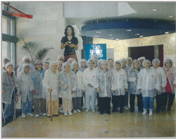
ביקור מועדון וותיקים בשטראוס