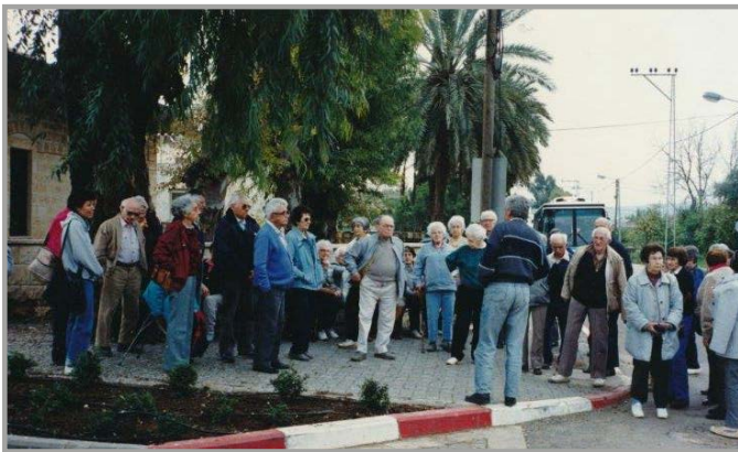
ביקור הוותיקים בחדרה - יובל להזורע 1986

מדרך הטבע מועדון ראשונים קטן אך אנו נברך אתכם יקירים: אספו כוח, חזקו ואימצו ומי ייתן שתמשיכו לפעול מעבר למאה ועשרים!!!!