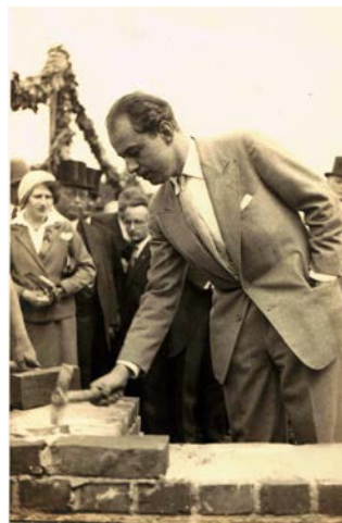
טייץ בטקס הנחת אבן פינה לבית בהכשרת גרוס גאגלו (Groß-Gaglow) 1391.

עיקר המאמץ כוון לסיוע במציאת מקומות עבודה חלופיים ויצירת מסגרות להכשרה מקצועית עבור צעירים. במקביל וביתר שאת - נפנה טייץ יחד עם מנהיגי הקהילה, ציונים ולא ציונים, לגייס תמיכה מקהילות יהודיות בארצות אירופה. במסגרת זו גם ניתנה עדיפות והכרה להגירה לפלשתינה, אף כי טייץ לא הגדיר עצמו ציוני. במקביל פותחו חוות הכשרה ברחבי גרמניה ואף הוקמו יישובים חקלאיים במחשבה על עתיד מתמשך בגרמניה. כאן נפגש טייץ עם וילפריד ישראל והתיידד עמו, על אף יריבות עסקית לכאורה בין שתי המשפחות, שלשתיהן בתי מסחר גדולים בברלין ומחוצה לה. כמו וילפריד ישראל, גם לודוויג טייץ ראה חשיבות עליונה