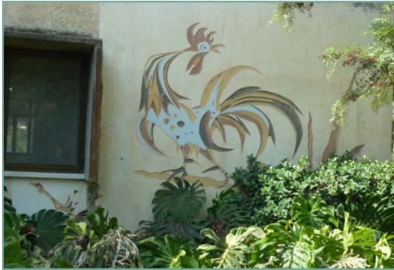
תבליט התרנגול כיום