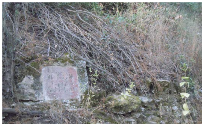
המצבה בבית הקברות הישן, גן טייץ - היום