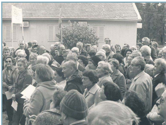
טיול הוותיקים לחדרה ביום הוותיק 1981