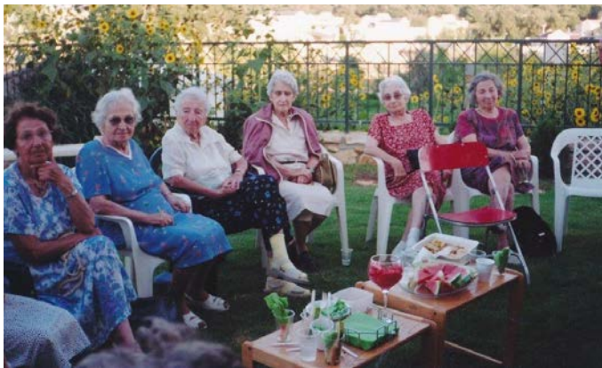
מועדון ראשונים מבקר אצל משפחת מעוז בהסוללים 2003