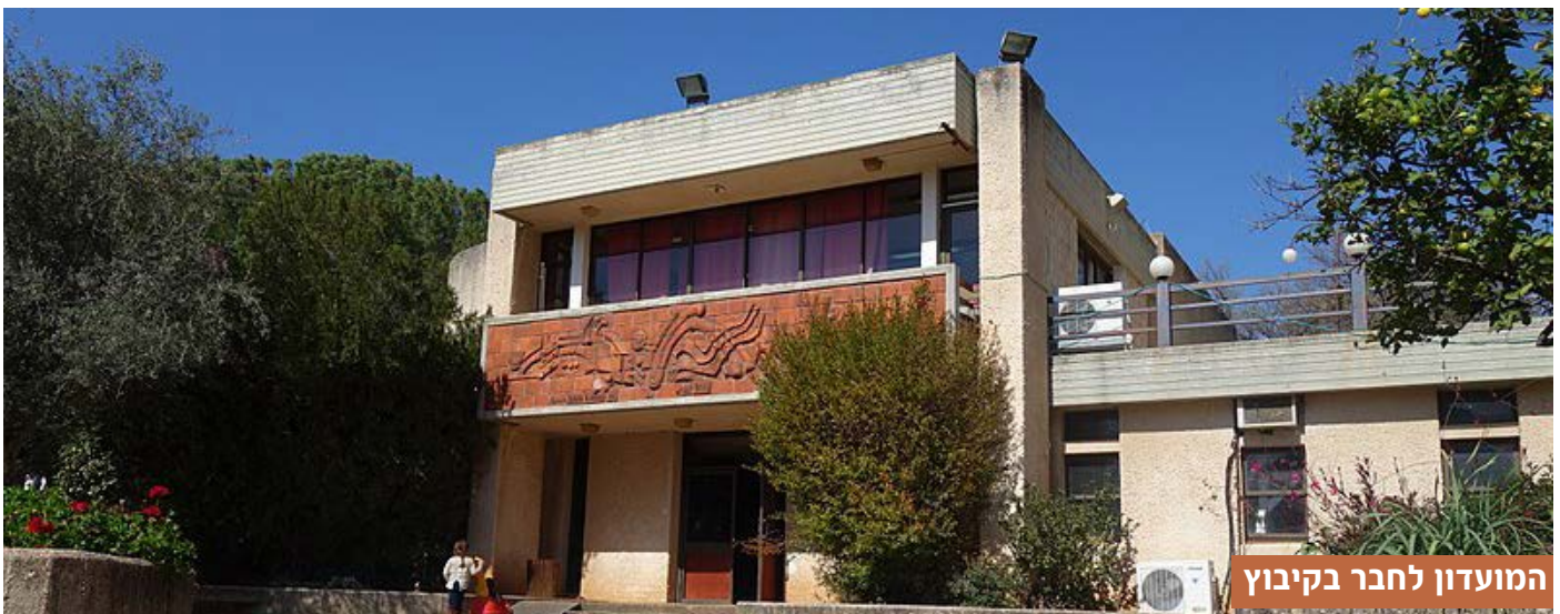
המועדון לחבר בקיבוץ

יש לנו מקום גדול וחם בלב - לאנשים הטובים ולמקום הנהדר הזה: מאחלים עד מאה ועשרים! ✂