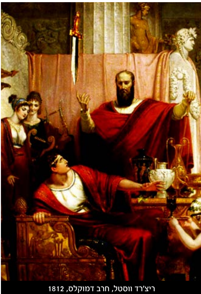
ריצ'רד ווסטל, חרב דמוקלס, 1812