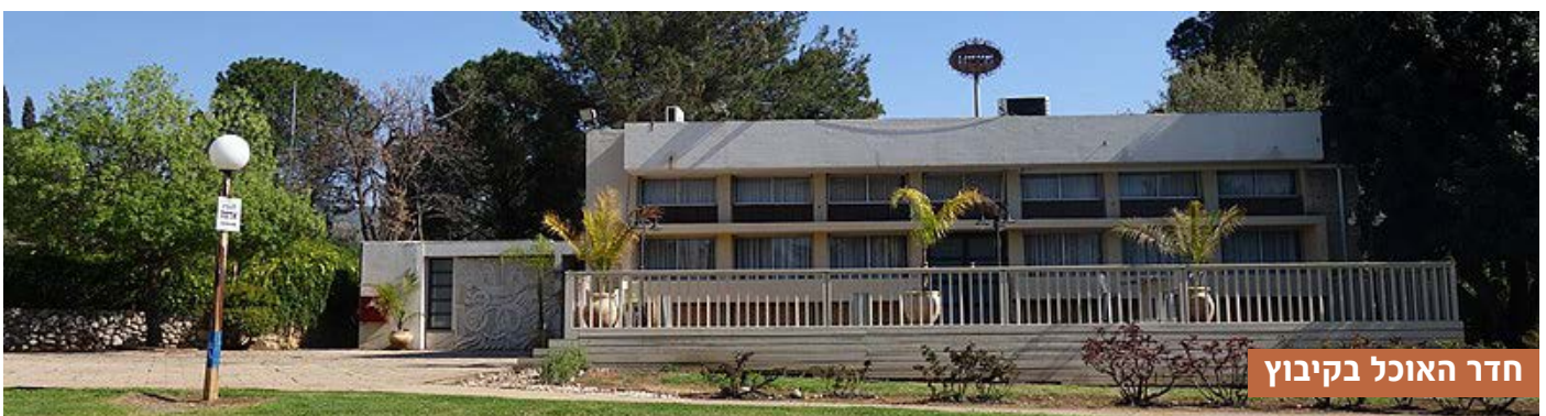
חדר האוכל בקיבוץ