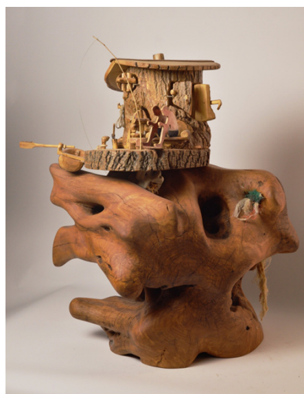
היצירה שזכתה במקום ראשון בתחרות במועצה האזורית ועם האומנים שזכו במקום שני ושלישי הם הוזמנו לתחרות בבליה *