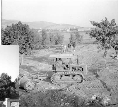
התחלת בניית בית וילפריד