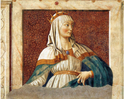
אסתר המלכה / אנדריאה דל-קסטניו, צייר איטלקי, 1457-1423

חג פורים המתקרב אלינו בעוד כשבוע מביא איתו שמחה גדולה כחלק ממצוות החג. הילדים זוכים להתחפש לדמות אהובה ואילו המבוגרים חוגגים בשמחה מתפרצת, לעיתים מתפרצת מידי, בעידודו של האלכוהול החופשי המחולק במסיבה. מלבד המצווה לשמוח אנו מצווים גם לקרוא את המגילה ולחלק משלוחי מנות לחברים ולנזקקים.