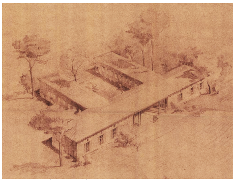
סקיצה שתיכנן האדריכל מנספלד את בית וילפריד, 1946