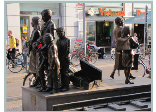
בתחנת הרכבת ברלין – לצד אחד יוצאות רכבות המוות למחנות ההשמדה, לצד השני ילדי הקינדרטרנספורט להצלה וחיים. פסל של מיזלס.