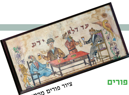
ציור פורים מהמאה ה-19