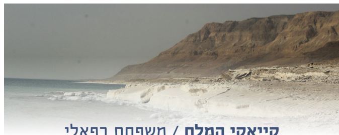
קייאקי המלח / משפחת רפאלי

הנופים של ים המלח מוכרים לכולנו, אבל השייט בו מספק הצעות ייחודיות ולוקח אותנו לאזורים בים המלח שרגל אדם לא דרכה בהם.