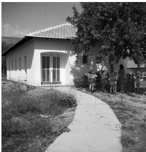
המרפאה החדשה 1951