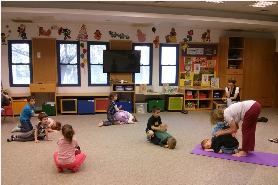
פעילות הגנים בספרייה, גן שקד בשיעור יוגה

גם לצלם, לסרוק ולהדפיס חומר ולעשות למינציה לדפים. כאמור מלבד הספרים המקום פתוח להרבה פעילויות נוספות: