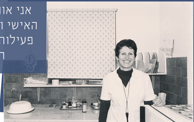
1986 - צלם גבריאל פלטי

"כבר כמה שנים חשבתי שאני רוצה להמשיך ולתרום על ידי ביקורי בית. אצל אנשים מבוגרים שפחות יוצאים מהבית או אנשים עם בעיות בריאות ממושכות. אני אוהבת את הקשר האישי ולא יכלתי לשלב פעילות זו עם העבודה הרגילה..."