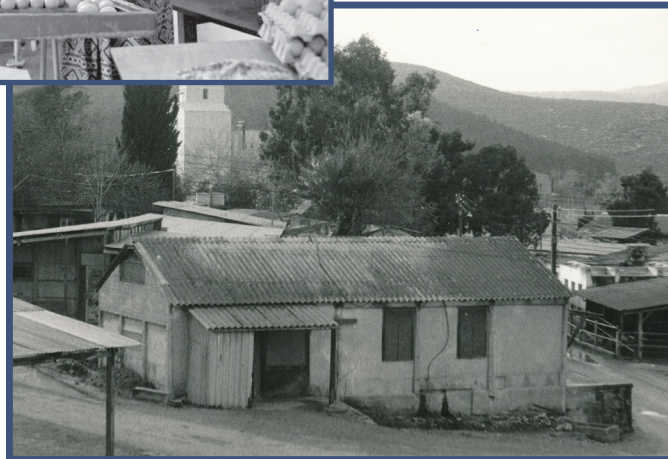
"תמונה עליונה: מיון הביצים במה שנקרא "מחסן הביצים" - תמונה תחתונה: 3 - מחסן הביצים, צילמה אידית פרוינדליך, 1977