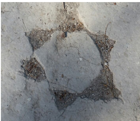
מגן דוד שזיזה כהן שלחה, עמליה ומאיה לא יצרו אותו