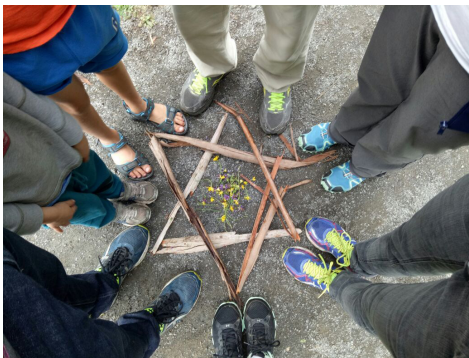
מגן הדוד שהגיע מאוסטרליה