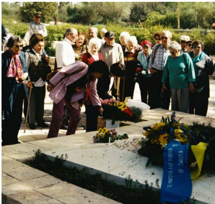
וותיקי הזרוע לרגל 60 שנה לקיבוץ, נסעו לבקר אצל נשיא המדינה ועלו לקברו של רבין (1996)