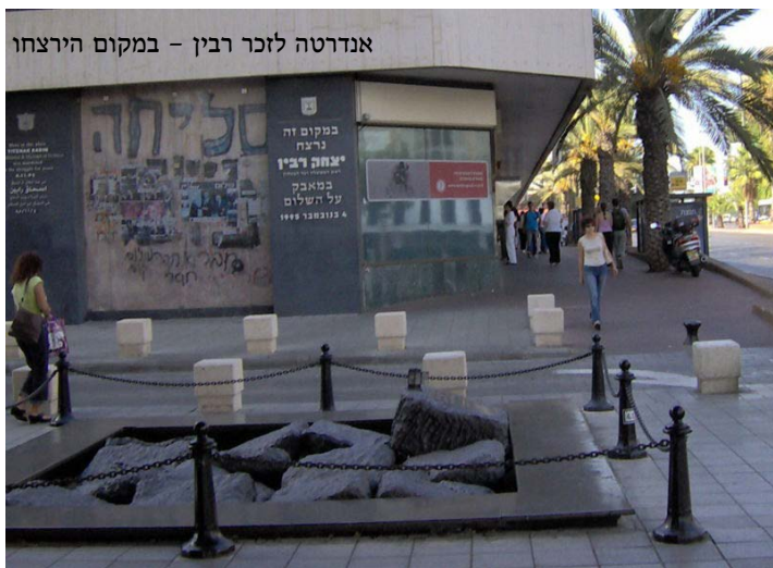
אנדרטה לזכר רבין - במקום הירצחו