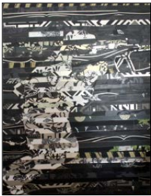
אילת זהר, צלף שחור