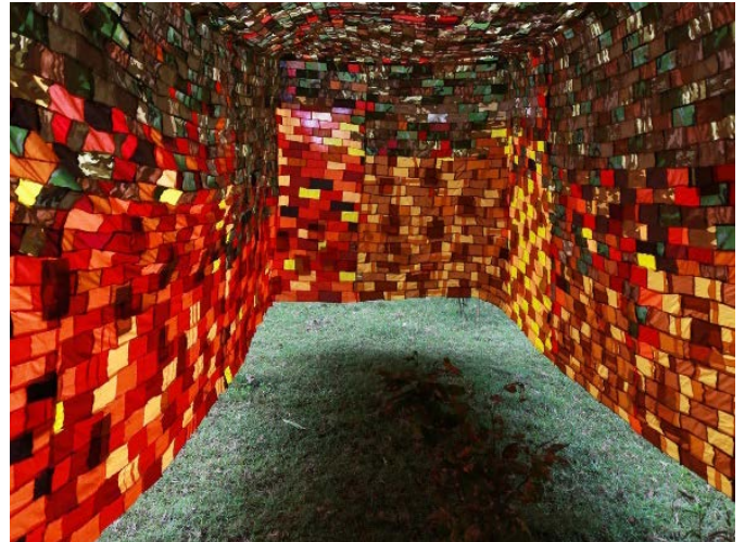
קאהן בוי קונג

בפעם הראשונה תוצג במוזיאון וילפריד תערוכה של אמן ויאטנמי עכשווי.