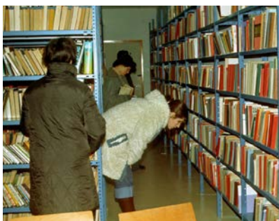
ספרייה בבית וילפריד אורזל גינוסר