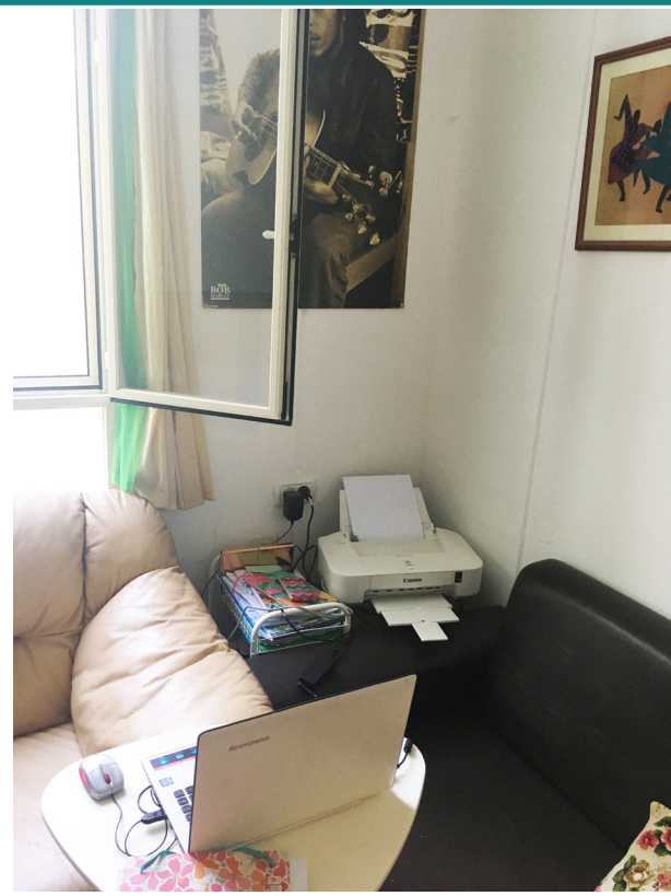
פינת עבודה - תרתי משמע - בין הספות בסלון פינת קפה שהוסבה למטבחון

גם על התכנון הפנימי של הדירה - ובשביל מה כל זה? כדי שסבתא שלי, לילי, תהיה מרוצה שאני פה? כל חיי הייתי גאה במקום ממנו אני באה, ומאז השינוי בהזרוע, משנה לשנה, המערכת דוחקת אותי החוצה. אז רגע לפני שאני עוזבת, רצייתי לכתוב את הדברים ולשתף כי עדיין אכפת לי ואני עדיין בת הקיבוץ.