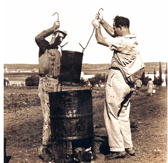
קו המים כפר יהושע 1939-1960