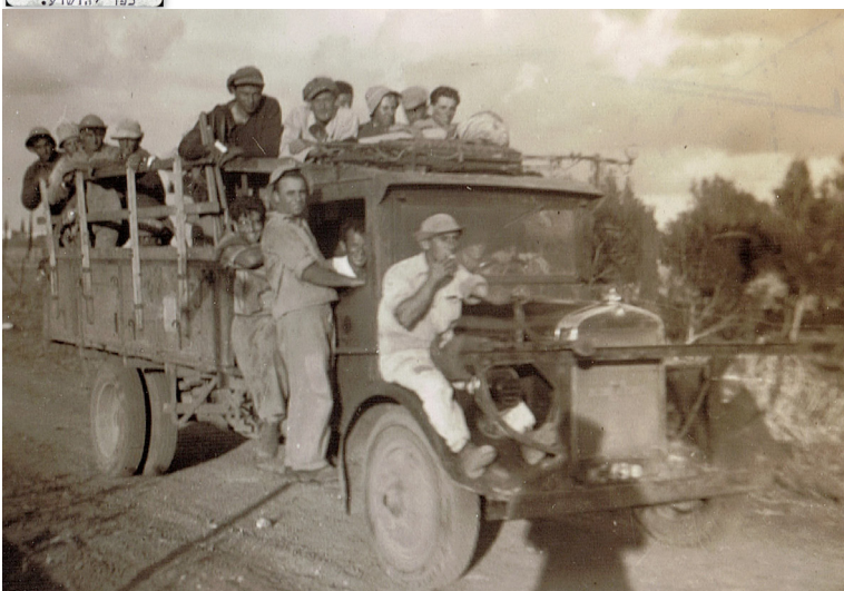
קו מים כפר יהושע-הזורע 1940-41