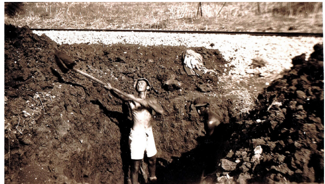
העברת צינור המים מתחת פסי הרכבת בקו המים מכפר יהושע להזורע 1940-1941

מכתב על הנחת הצינור מסגרת המילט של כפר יהושע ע.