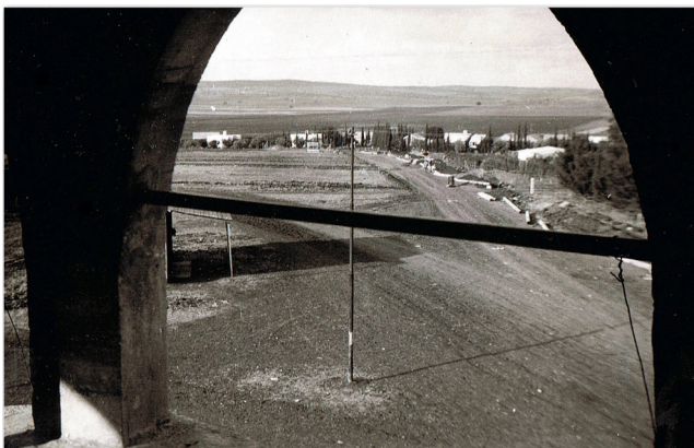
קו מים כ.יהושע-הזורע 1940-41