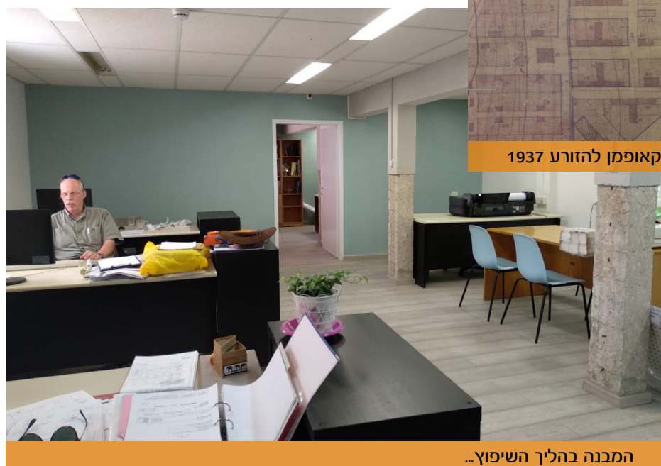
המבנה בהליך השיפוץ...