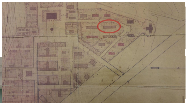
בית מס' 3 ע"ג קטע מתכנית אדריכל ריכרד קאופמן להזורע 1937