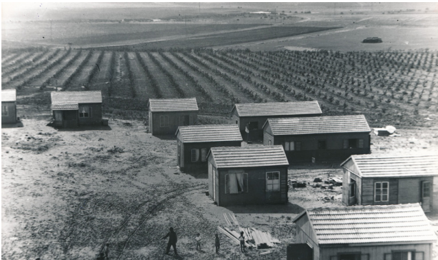
בגבעת חיים. ארכיון הקק"ל