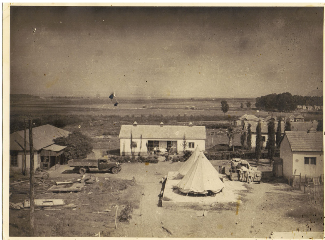
חדרה - המחנה הראשון והאוטו פורד הראשון. 1934.

מצורפים המכתב של מרדכי שטנר (תמונה 1) המנסה לשכנע את חברי הוורקלוייטה לעלות לעמק בית שאן ותרגום המכתב של אורי בר (תמונה 2) המסביר כי הקבוצה לא יכולה להתחייב להישאר חצי שנה בקיבוץ.