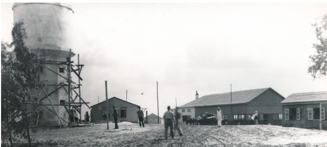
הכניסה לגבעת חיים.