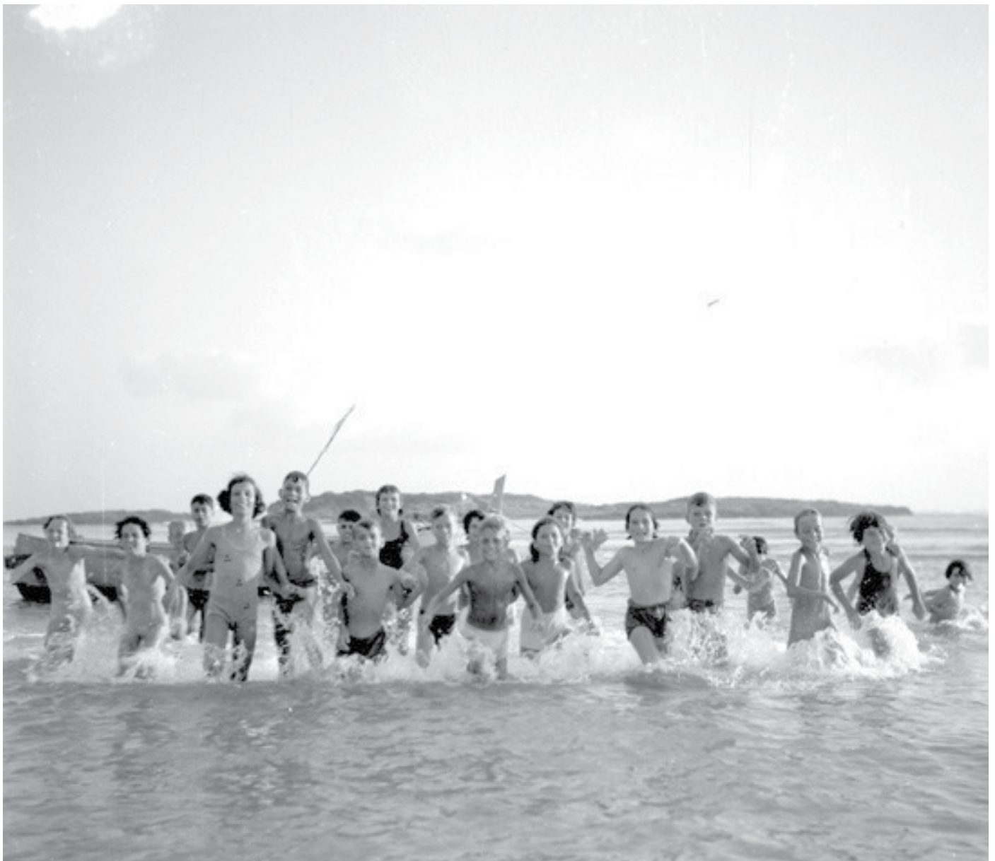
קייטנה בטנטורה 1951