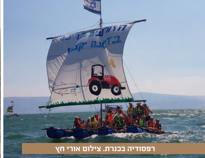
רפסודיה בכנרת.