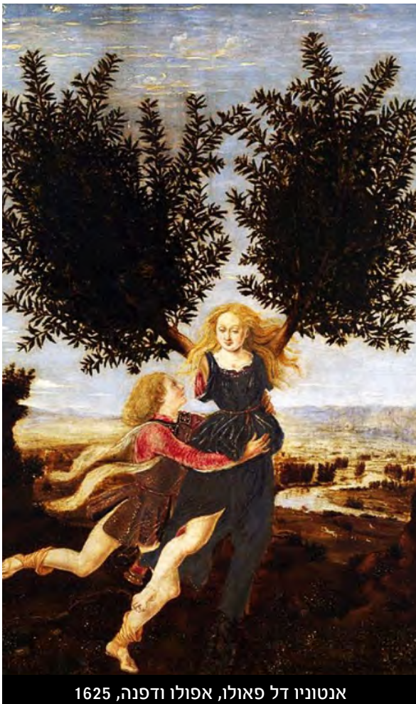
אנטוניו דל פאולו, אפולו ודפנה, 1625