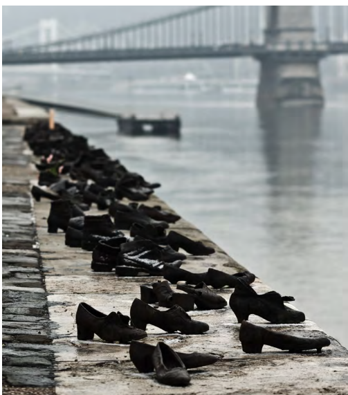
נעליים על הדנובה. אדנרטה המנציחה מאות מיהודי הונגריה שנרצחו והשלכו לנהר.