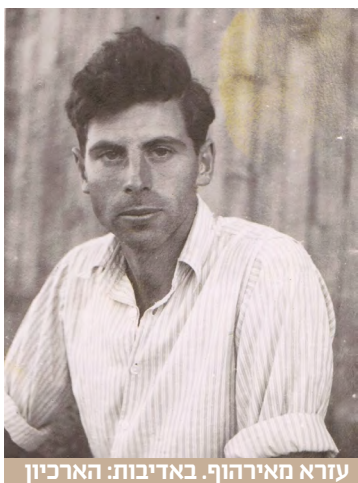
עזרא מאירהוף. באדיבות: הארכיון

זוהי הכוריזיה ההדורה ( Ceiba speciosa ), קרובת משפחה של עצי הבאובב, אשר פורחת בוורוד יפה במשך הקיץ ובחורף עומדת בשלכת. הפרי של הכוריזיה (שמבשיל בעונה זו) הוא הלקט דמוי אבוקדו ותוכנו מזכיר צמר-גפן או סיבי משי, ועל כן העץ קרוי באנגלית "עץ סיבי המשי" ( silk floss tree ). מקורו ביערות הטרופיים והסוב-טרופיים של דרום אמריקה שם