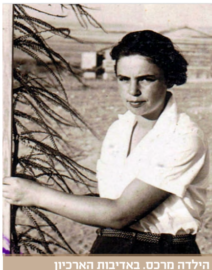
הילדה מרכס. באדיבות הארכיון

פוטנציאל הטיפוס והמשחק). זהו ברוש הביצות או בשמו המדעי "טכסודיום דו-טורי" ( Taxodium distichum ). בדומה לרבים מהעצים שניטעו כאן בהזורע אי אז בשנות ה-40 וה-50 של המאה הקודמת, גם ברוש הביצות הוא אורח מ"כוכב אחר". ארץ המקור שלו היא המישורים המוצפים ושטחי הביצות של דרום-מזרח ארה"ב ובעיקר פלורידה. זהו עץ מחטני שבאופן יוצא דופן לסדרת המחטניים, אשר ברובם הם ירוקי עד, ברוש הביצות הוא נשיר מותנה, ולכן קרוי בארץ המוצא שלו "ברוש קירח" (Bald)