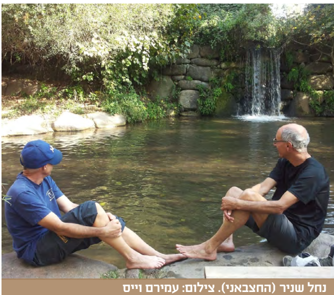
נחל שניר (החצבאני).