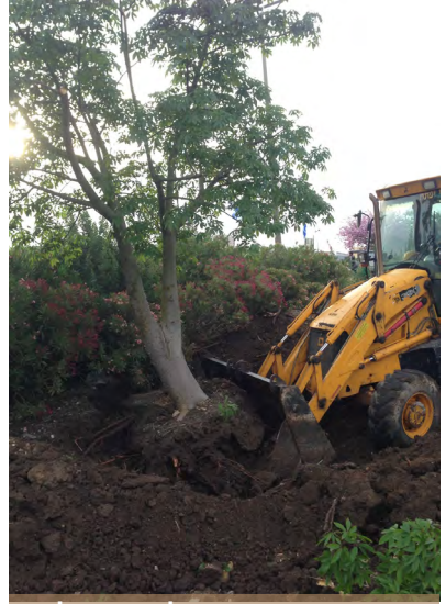
כוריזיה עוברת בית.