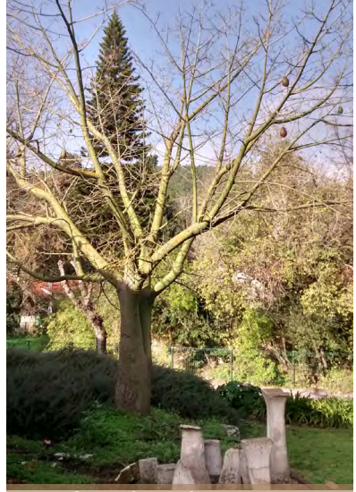
כוריזיה הדורה בשלכת

האינדיאנים השתמשו בגזעי ברוש הביצות כחומר בניה למגוון שימושים, בין השאר לבניית סירות קאנו עמידות וחזקות. ובחזרה לקיבוץ הזורע... ברושי ביצות רבים נשתלו לאחר השלג המפורסם של שנת 1950 אשר הפיל "חללים" בקרב הפיקוסים. שניים מאותם ברושים ניטעו על הדשא הגדול ושדירה נוספת התחילה בחדר האוכל ונמשכה עד שעה הקיבוץ. מי שהכניס לחיינו את ברוש הביצות הוא עזרא מאירהוף, אבי הגינון של קיבוץ הזורע, אשר ריכז את ענף הנוי במשך 28 שנים, מ-1942 ועד 1970. לפני כשלוש שנים, רן סולומון - רכז הנוי, הוסיף לעץ את עמוד התמך הנוכחי שלו על-מנת לסייע לענף בעל הצימוח האופקי לשאת את משקל המטפסים והמתנדנדים עליו. הענף צפוי להמשיך ולהתארך לכיוון הקרקע ולבסוף להשריש לתוכה ולקבל ממנה תמיכה. וכשזה יקרה ניתן יהיה להסיר את העמוד.