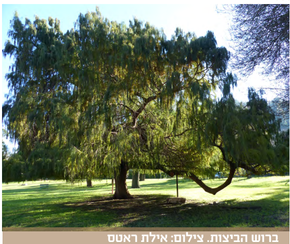
ברוש הביצות.

שימש את הילידים, בדומה לברוש הביצות, לבנית סירות קאנו, שזירת חבלים ועוד. הכוריזיה העומדת איתן ליד המוזיאון היא אחותה התאומה של כוריזיה נוספת הניצבת בכר הדשא שבכניסה לקיבוץ, בהמשכו של מגרש החניה - מול הרמפה של המוסך. שתי האחיות עמדו בעבר בסמיכות זו לזו, כאשר זו הניצבת כיום ליד המוזיאון עמדה אז במיקום בו עובר היום הכביש החדש, בצמוד לכיכר. מי נטע אותן ומתי - לא עלה בידי לגלות. הכוריזיות התאומות הופרדו לקראת סלילת הכביש בשנת 2014 והכוריזיה שלנו הועברה אחר כבוד, במבצע מיוחד, לביתה החדש.