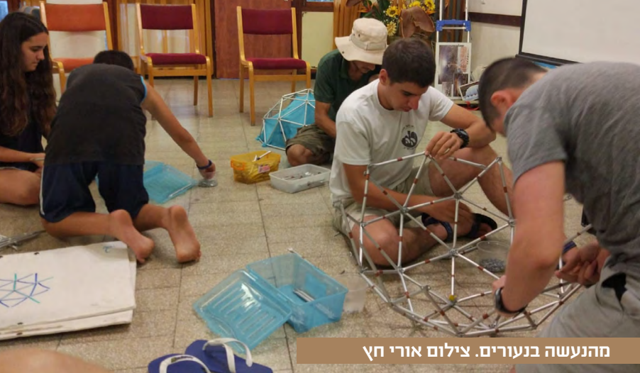
מהנעשה בנעורים.