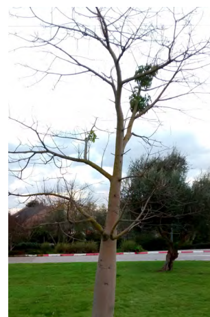
האחות התאומה בכניסה לקיבוץ.

הרוחות הרעות רדפו אותה בכל אשר פנתה. ביאושה החליטה ארברה להתחבא בתוך גזע עץ הכוריזה ושם ילדה את בנה. הבן גדל והגשים את הנבואה, בהרגו את הרוחות הרעות, ובכך נקם את נקמת אמו שנאלצה להישאר בתוך גזע העץ לשארית חייה. מאז ועד היום אוהבת ארברה לצאת החוצה בצורת פרח ורוד ויפה אשר מושך אליו את יונקי הדבש, ובדרך זו היא ממשיכה לפגוש את בעלה המלך קוליברי.