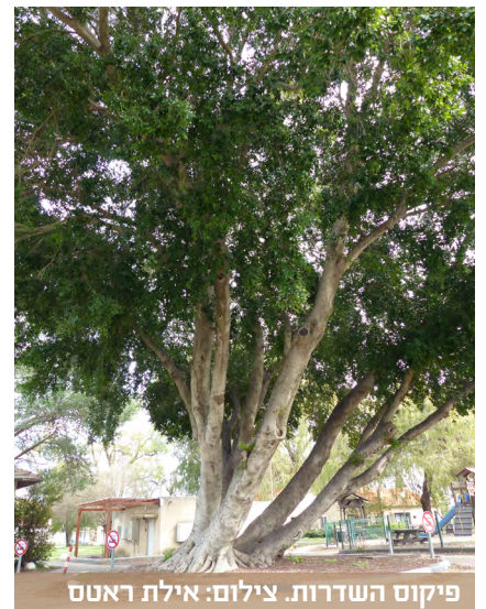
פיקוס השדרות.