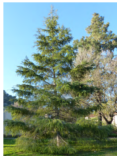
ארז הימלאי.