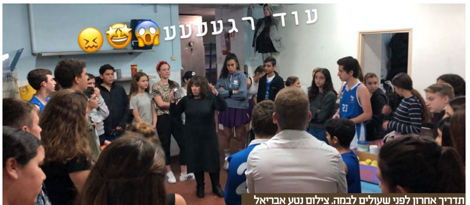
תדריך אחרון לפני שעולים לבמה.