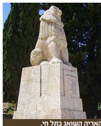
האריה השואג בתל חי.

אל תפספסו את הקטע השני של שביל ישראל, כי הוא הרבה יותר יפה מהקטע הראשון. כשאתה הולך על הרכס מעל קריית שמונה, כשעמק החולה פרוש לרגליך ומעליו ה חרמון הלבן כשלג, אתה מרגיש כמו בגן עדן. יפי הבלורית והתואר מהגדוד השלישי של הפלמ"ח התחילו את מסעם לכיבוש נבי יושע במאי 1948 ממחנה פילון, ליד אליפלט, ואיבדו 28 לוחמים, ביניהם את דודו האגדי. לעומתם, קבוצת השביליסטים שלנו מתחילה בדצמבר 2015 את מסעה לעבר מצודת כח אצל טרומפלדור בתל חי , וכמעט מאבדת את אחד מלוחמיה, איתמר שפייר , שנותן קפיצה מפחידה ברכס מנרה, מעל תהום של 500 מטר. סליחה, שכחתי: אל שלושת כוכבי קטע מס' 1 - עמירם וייס, יוסי שמע ועבדכם הנאמן, מצטרפים הפעם עוד 6 לוחמים: גיל מאיר בנו של פרוויקה מהגדוד הראשון של הפלמ"ח (קרוב מלכיה), ערן שפייר מגדוד ONE1 , אלי שובל מיקנעם ושלושה לוחמים צעירים - מיקי שמע (הבן של יוסי), אלון ואיתמר שפייר (הבנים של ערן). בדרכנו ל"תצפית רמים" המשגעת באזור צוק מנרה, לוקח איתמר ברצינות את סיסמתו של טרומפלדור "טוב למות בעד ארצנו" , ומקצר