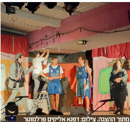
מתוך ההצגה.