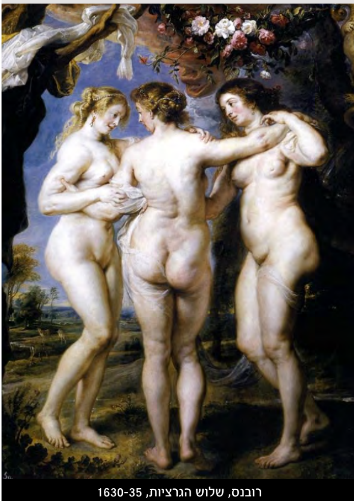
רובנס, שלוש הגרציות, 1630-35

שבת שלום (עם רון בלב ואת ביד...) אהוד דור