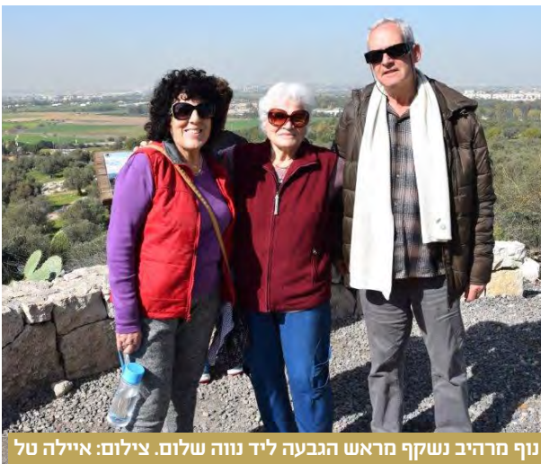
נוף מרהיב נשקף מראש הגבעה ליד נווה שלום.

הייתה זו זכות אדירה עבורי להיחשף לחכמתו של רמי בהזדמנויות רבות, או במקרים מסוימים לעקשנות