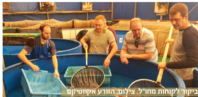
ביקור לקוחות מחו"ל.

מה קורה במדגה? בשבועות האחרונים התחילו ביקורי לקוחות במחלקת דגי הזהב ובמחלקת הקוי. אנו עובדים על הצגת מיטב המוצרים שלנו בפניהם.