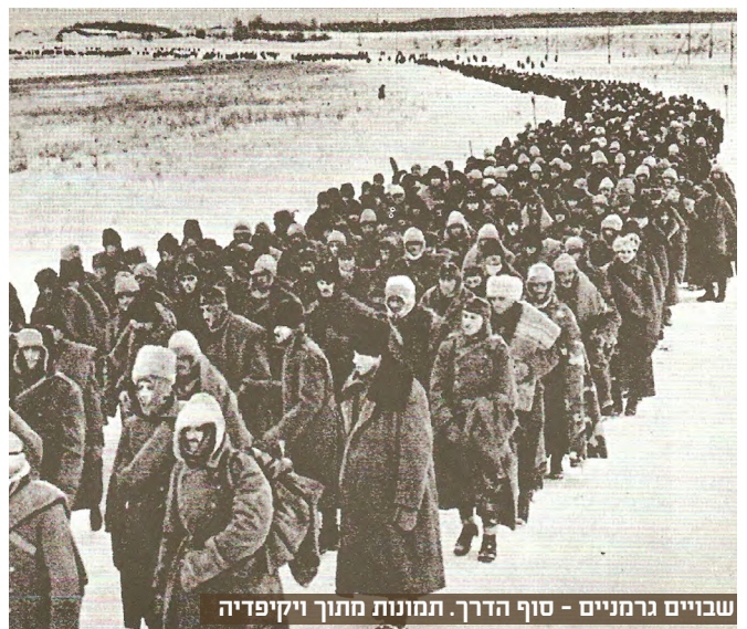
שבויים גרמניים - סוף הדרך.

המתקפה החלה באמצע יולי 1942, עם הצלחות גרמניות מרשימות. הגרמנים השתלטו על אזור הזון, והגיעו בראשית אוגוסט עד גדות הוולגה, מרחק של כ-100 ק"מ