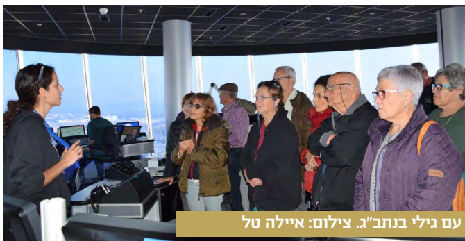
עם גילי בנתב"ג.

להיות חלק חשוב מהאזור ומהסביבה שלנו. לסיום, תודה לאיילה טל ולדני אשכרי על ארגון הטיוול. היה לנו טיוול מעניין ומהנה בו נפגשנו פנים אל פנים עם חלקים שונים של החברה הישראלית. היה כיף לפגוש את כל מי שהשתתף בטיול ולהיווכח שעדיין יש לנו את ה"ביחד", גם לאחר תהליך השינוי שהקיבוץ עבר בשנים האחרונות.