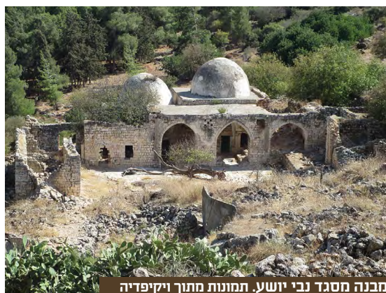
מבנה מסגד נבי יושע.