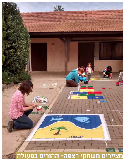
מציירים משחקי רצפה - ההורים בפעולה