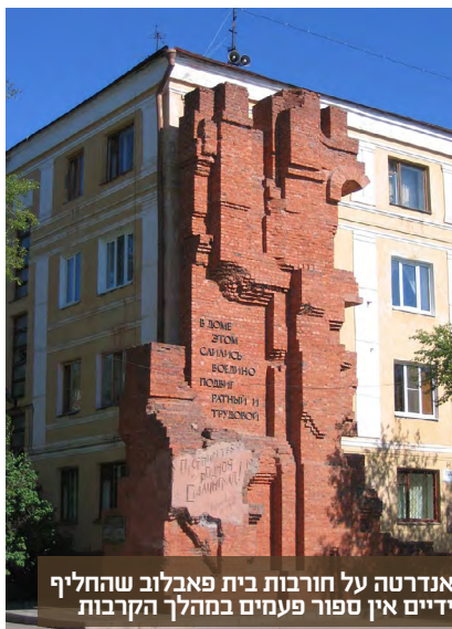
אנדרטה על חורבות בית פאבלוב שהחליף ידיום אין ספור פעמים במהלך הקרבות

הרחק בעורף הנאצי. סטלינגרד הפכה לכיס מכותר. גם עתה היטלר לא הבין את גודל הסכנה ואסר על הגנרל פאולוס, מפקד הארמיה השישית, לפנות אחורה ולנסות לפרוץ את המצור. הגרמנים ניסו, ללא הצלחה, לשלוח חיל "ישועה" שישימך את הכוחות המכתרים. כשהיטלר התעורר זה כבר