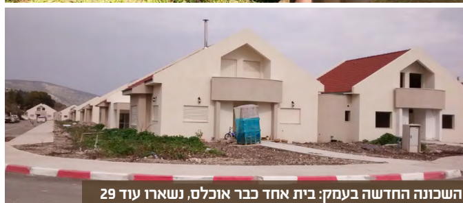
השכונה החדשה בעמק: בית אחד כבר אוכלס, נשארו עוד 29