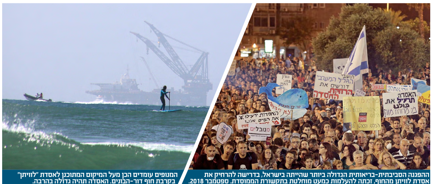
המנופים עומדים הכן מעל המיקום המתוכנן לאסדת "לוויתן" בקרבת חוף דור-הבוניס. האסדה תהיה גדולה בהרבה.

התכנית המקורית של "נובל אנרג'י", השותפה הראשית במאגר הגז "לוויתן" והמפעילה של אסדת הגז,