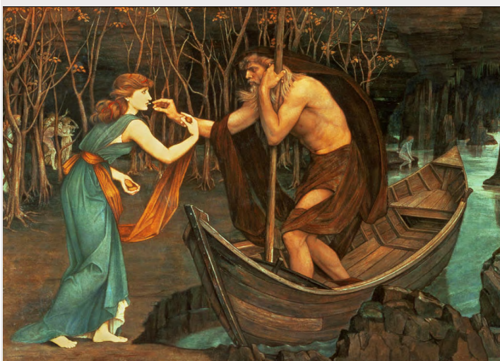
ג'ון רודאם ספנסר סטנהופ, המטבע של כארון, 1883