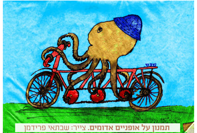
תמנון על אופניים אדומים. ציור: שבתאי פרידמן