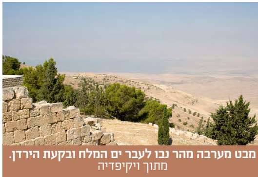
מבט מערבה מהר נבו לעבר ים המלח ובקעת הירדן. מתוך ויקיפדיה

"ותרא האשה כי טוב העץ למאכל וכי תאנה-הוא לעינים, ונחמד העץ להשכיל, ותקח מפריו, ותאכל; ותתן גם-לאישה עמה, ויאכל. ותפקחנה, עיני שניהם, וידעו, כי עירמם הם; ויתפרו עליה תאנה, ויעשו להם חגרת". (בראשית ג',