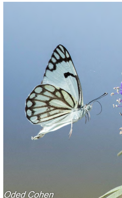
*צילומים: עודד כהן