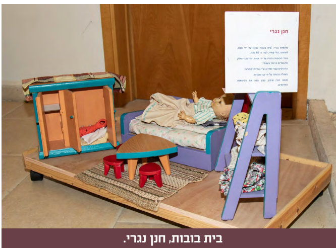
בית בובות, חנן נגרי.

יהודה עמיחי, מתוך ספרו "פתוח סגור פתוח" בהוצאת 'שוקן'