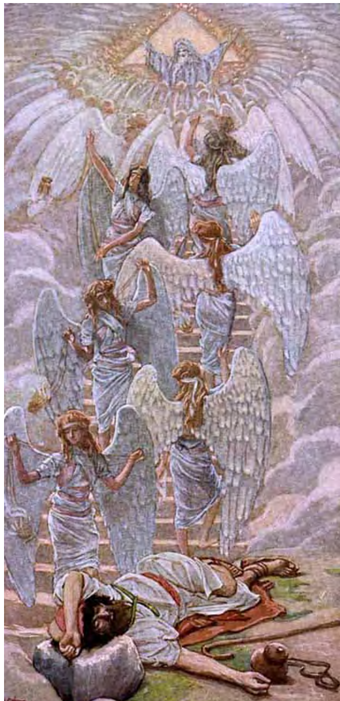
חלום יעקב מאת ג'יימס טיסו (1836-1902) "וַיַּחְלֵם וְהִנֵּה סֻלָּם מַצְבֵּי אֶרֶץ וְרִאשׁוֹ מֵגִיעַ הַשָּׁמַיְמָה, וְהִנֵּה מַלְאֲכֵי אֱלֹהִים עֹלִים וְיֹרְדִים בּוֹ" (בראשית כ"ח, י"ב). יעקב יוצא מבאר שבע ועוצר ללילה בבית אל. בחלומו הוא רואה סולם, העולה מן הארץ עד השמים ומלאכים עולים ויורדים בו. אלוהים מתגלה ליעקב ומבטיח לו שמירה בכל קורותיו וריבוי בנים. יעקב מתעורר, מכריז על המקום 'בית אלוהים', מציב מצבה לציון המאורע ונודר לעשר מעשר מכל רכושו.

היכן נמצא דימוי כל כך קולע לעוצמה של אהבה? ולאחר ליל הכלולות עם רחל, הוא מתעורר עם לאה בבוקר: "וַיְהִי בַבֹּקֶר, וְהִנֵּה-הוּא לְאָה...". (בראשית כ"ט, כ"ה) ושוב, שבע שנים של עבודת פוך אצל לבן, עבור רחל. והנה, ליעקב שתי נשים. זו אהובה וזו שנואה. האהובה - עקרה, והשנואה - ולדנית ופורייה. יחד עם שתי הפילגשים, יעקב הוליד 12 בנים ובת.