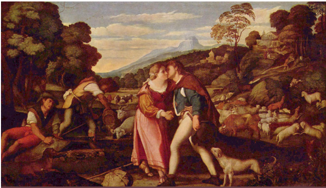
יעקב ורחל, מאת פלמה די וקיו (1528-1480).

המסורת היהודית, כמובן, הולכת עם יעקב לאורך כל הדרך, ומציגה את עשו כטיפש (שמכר את בכורתו בנזיד עדשים) וכרשע, שרודף ומאיים על אחיו יעקב... הטקסט התנכי, לעומת זאת, מציג את עשו כאיש פשוט, ארצי ומאוד אנושי. בא עייף ורעב מהשדה, והיה מוכן לתת הרבה בשביל תבשיל מזין. ומהי הבכורה בשבילו? הוא האח החזק, בעל הכוח והנשק (צייד), מה