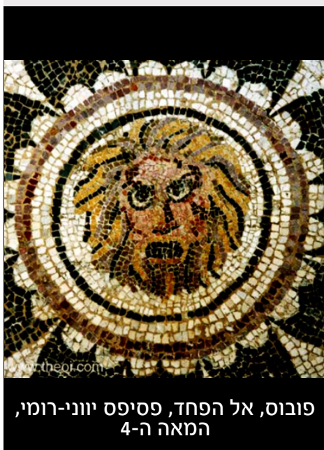
פּוֹבּוֹס, אל הפחד, פסיפס יווני-רומי, המאה ה-4