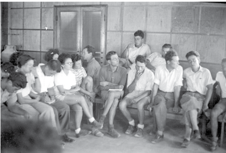
שיחות על הצטרפות לשוה"צ

אמנם נכון הדבר. בחודשים האחרונים חלה תמורה רצינית: שוב משתתפים בשיחה ושוב אין מאחרים לשכת אחרי חצות. אך עם כל ההתפתחות הרצויה הזאת צריך לציין כמה וכמה ליקויים של השיחה, שאנו מצויים לתת את דעתנו עליהם, באשר הם מסילים לעתים ספק רציני ביעילות ובמעשיות המנגנון ה"פרלמנטרי" שלנו; אמנה כאן כמה מליקויים אלה, שאיש מאתנו לא יוכל להתעלם מקיומם; יש מהם והם מכת כלל-הקיבוצים ויש מהם "ספציפיים" שלנו. הדברנות , מפלצת איומה זו, מרימה את ראשה מטעם לפעם. ישנם חברים שאינם מרכזים את התקפותיהם לכיבוש דעת הקהל אלא פועלים לפי שיטת "הפיזור". הם מוכנים לדבר שלוש, ארבע פעמים על אותו ענין הקרוב ללבם (ויש הרבה ענינים הקרובים ללבם בעונותינו הרבים!). אם בהתחלה הנאות היה בעקיפין יותר - עתה כשהענין סוּיֵס עומד להיחתך, הם לוחצים בהתלהבות הולכת וגוברת בכיוון הרצוי להם. אמצעי יותר טוב הביטוי הברור והישר, המרוכז והקצר, אשר פחות מדי חברים יודעים את סודו. הללו משטיעים ללא ספק השפעה מברעת על ההצבעה, אשר רוב החברים מחכים לה כבר באי-סבלנות. וראה זה פלא: היושב-ראש כבר קם על רגליו כדי למנות קולות המחייבים המתנגדים והנמנעים למיניהם, והנה נזרקת לתוך חלל הדר-האוכל נוסחא חדשה, אשר היא כביכול תציל אותנו ואשר מצטיינת במעלות חשובות, כלומר, שקשה לעמוד על סיבה, על כוונתה. עכשיו מגיע הויכוח לשיאו; וצעות הצעות חדשות לבקרים. לא תמ"ד זוכה ההצעה הכי ברורה לרוב דעות, אדרבא, לפעמים מעדיפים עליה את הנוסח המעורפל ביותר. האם יש כאן רצון לפשרה או רצון לעירפול? למנסחי הנוסחים פתרונים!