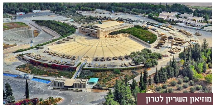
מוזיאון השריון לטרון

קטע מס' 20 של 'שביל ישראל' מזכיר מאד טיול שגרתי לחו"ל, כלומר: אין בו שום דבר מיוחד. האטרקציה המרכזית: מנזר השתקנים בלטרון . בדיוק כמו שקורה בכל אטרקציה מדהימה בחו"ל, חבורת השביליסטים נכנסת למנזר השתקנים, עם תרמילים במשקל ממוצע של 6 קילו, ויוצאת ממנו עם תרמילים במשקל ממוצע של 6.75 קילו. הסיבה ברורה: כל תרמיל זוכה לתוספת של בקבוק יין משובח, שמיוצר ביקב של המנזר, ועלותו מזכירה את עלויות הקניות שרובנו עושות ביום שישי השחור . הכוח נהנה גם מסיוור במנזר המרשים, שחברי הזרוע מכירים היטב מטיולי הקיבוץ לגדה המערבית, לאחר מלחמת ששת הימים. מעט לפני מנזר השתקנים, מפתיע אותנו הסיוור שעושה לנו שביל ישראל ב"יד לשריון". עד היום חשבנו, שיש ביד לשריון רק מוזאון טנקים וטקסי סיום להורים של חיילים שמשרתים בשריון. אבל מתברר, שיש כאן מקום תוסס, עם אנדרטאות מרתקות של חטיבות השריון, של צבא הגנה לישראל, לדורותיהן. בפעם הבאה שאתם מגיעים הנה לטקס משעמם, של סיום קורס מפקדי טנקים או סיום טירונות, קחו את הבן החייל שלכם, לאחר סיום הטקס, לסיבוב (לא קטן) בין האנדרטאות היפות האלה.