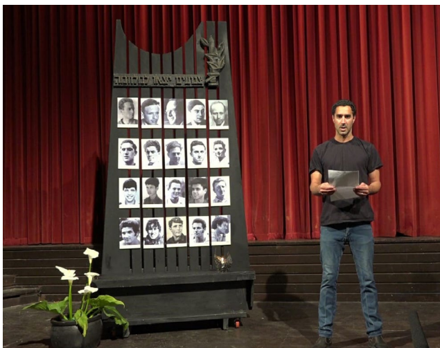
טקס יום הזיכרון לחללי מערכות ישראל