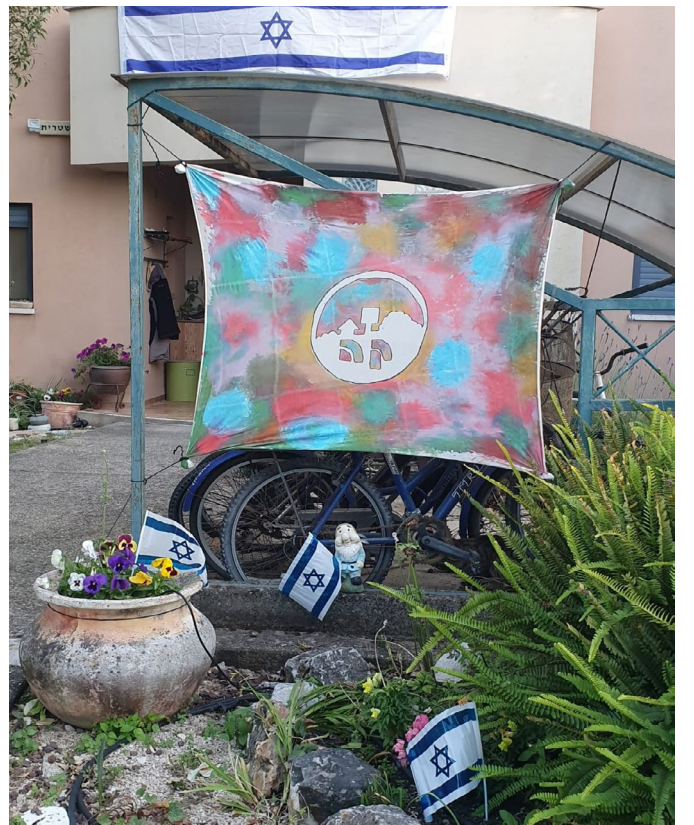
מקשטים לכבוד חג העצמאות: משפחות הוכמן, חזן, סולומון, שטרית ויפרח