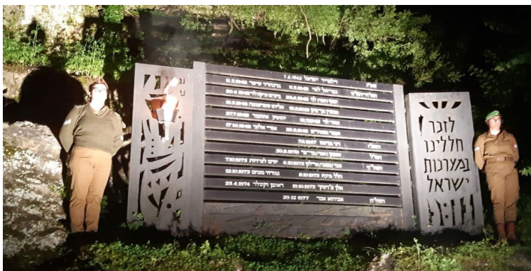
טקס יום הזיכרון לחללי מערכות ישראל

ביום הזיכרון התכנסנו אחר הצהריים וקיימנו ריצה בשטח הקיבוץ עם בני המשפחות השכולות, מבוגרים וצעירים וכמובן ילדים רבים, שהגיעו למיזם ' רצים לזכרם '. כל רץ קיבל מדבקה עם שם של אחד הנופלים מהזרע.