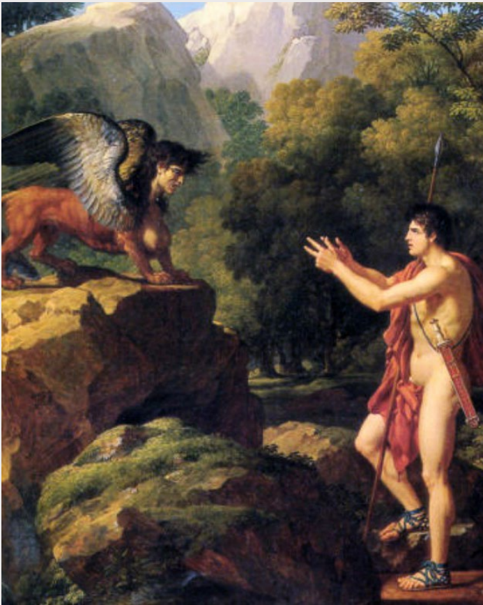
פרנסיסקו חאווייר, אדיפוס והספינקס, 1807