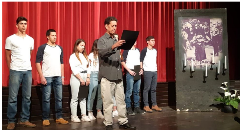
טקס יום הזיכרון לשואה ולגבורה