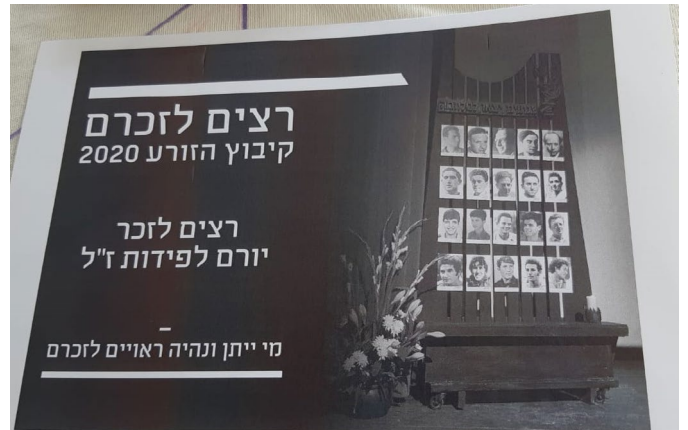
אחת המדבקות באירוע 'רצים לזכרם'

תודה ל צוות יום הזיכרון: מרים לוי, מעין ארז, יונת אבריאל, בטי הורן וענת פרוינד , שבזמן קצר הצליחו לארגן ולקיים את טקס הזיכרון בצורה מכובדת, עם מסר למשפחות השכולות - שזוכרים ומכבדים, אך מרחוק.