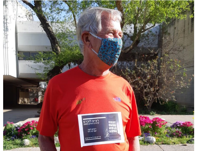
'רצים לזכרם' וגם שומרים על הכללים במסגרת ההגבלות

תודה ל גל אבריאל שיזם את האירוע, לאנה אבריאל שעיצבה את המדבקות לרצים, לרינה רשקוב שהכינה את המדבקות, לרז רפאלי און שעיצבה את המודעה, ולכל אלה שהגיעו ולקחו חלק.