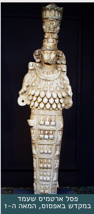
פסל ארטמיס שעמד במקדש באפסוס, המאה ה-1