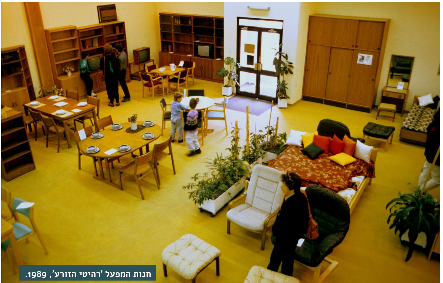
חנות המפעל 'רהיטי הזורע', 1989.