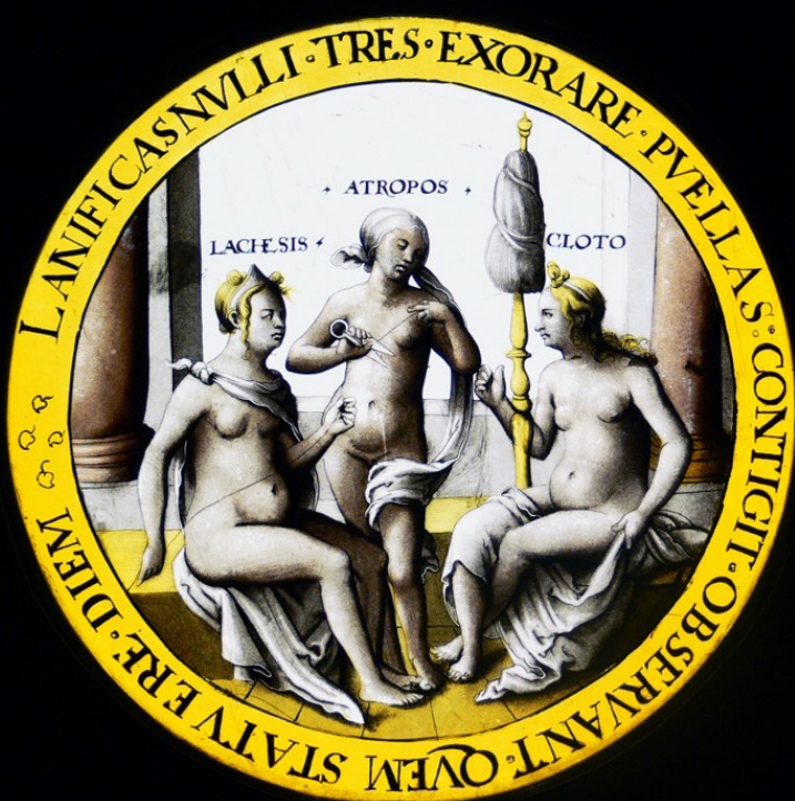
האנס ויסשר, המוירות – אלות הגורל, 1530