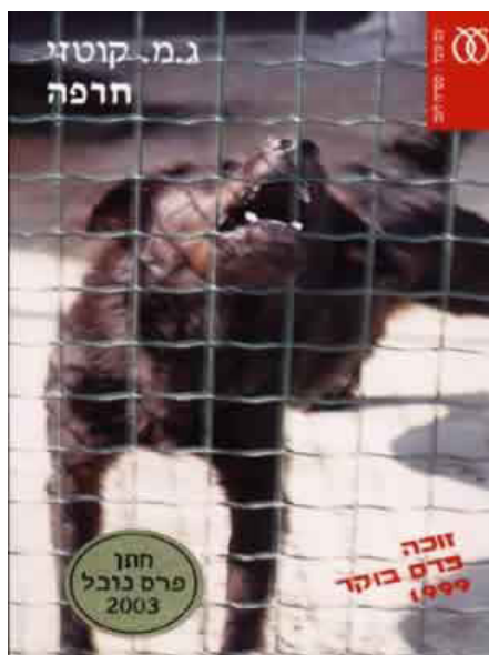
הוצאת עם עובד, 2000

■ שנה טובה, בריאה, שמחה ומלאת תקווה לכולם