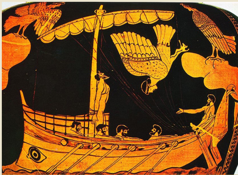
אודיסיאוס והסירנות, ציור על בד חרס, המאה ה-5 לפנה"ס