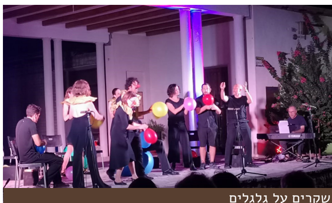
שקרים על גלגלים