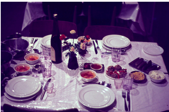
צילומים: ערב ראש השנה תשל"א (1970)