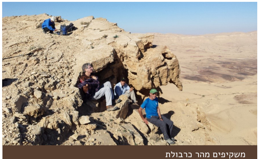
משקיפים מהר כרבולת