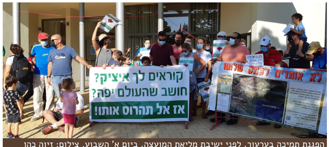
הפגנת תמיכה בערעור, לפני ישיבת מליאת המועצה, ביום א' השבוע.

לשמחתנו, העניין נודע לנו כ-10 ימים לפני הדיון המכריע בוועדת הגבולות. בהתייעצות דחופה, הוחלט בהזורע להגיש ערעור למליאת המועצה, ובפועל לכנס מליאת חירום ולדרוש הצבעה מחודשת, כאשר הכוונה לאחד את כל המועצה להתנגדות גורפת להעברת שטחים נוספים ליקנעם. לא השטחים המוצעים כעת ולא אחרים.