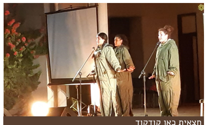
חצאית כאן קודקוד