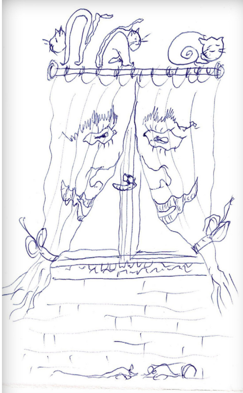
חתולים, וילונות ועכברים. צייר: שבתאי פרידמן

או למשל, אם וכאשר נצטרך לבצע פעילת גופנית מורכבת להצלחת חיינו (למשל פעולה הדורשת כוח או זריזות במצב חירום), בוודאי נרצה שמי שיבצע את הפעולה יהיה בעל אינטליגנציה גופנית גבוהה. כלומר, גם כאן היכולות והניסיון ישפיעו מאוד, הן על ביצוע מושכל והן על ביצוע מיידי ומהיר.