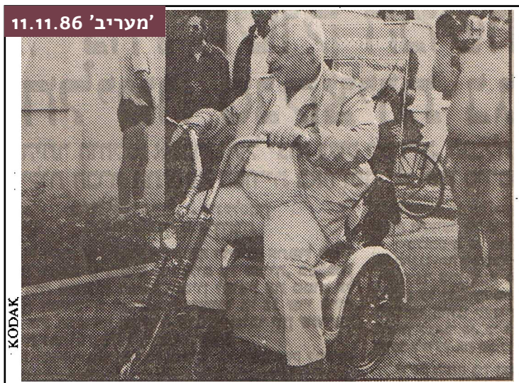
שר התעשייה והמסחר, אריאל שרון, בעת סיורו אתמול במפעלי התעשייה בקיבוץ עמק הירדן. בצילום: השר שרון נוהג ברכב חשמלי מתוצרת קיבוץ אפיקים

קיבוצים בעמק הירדן: איך כניסה לשר שרון "השנאה הפנימית היא מהתופעות החמורות ביותר במדינה" הגיב אריק שרון על סירובם של אפיקים, שער הגולן ובית זרע לארחו בעת סיורו בעמק הירדן