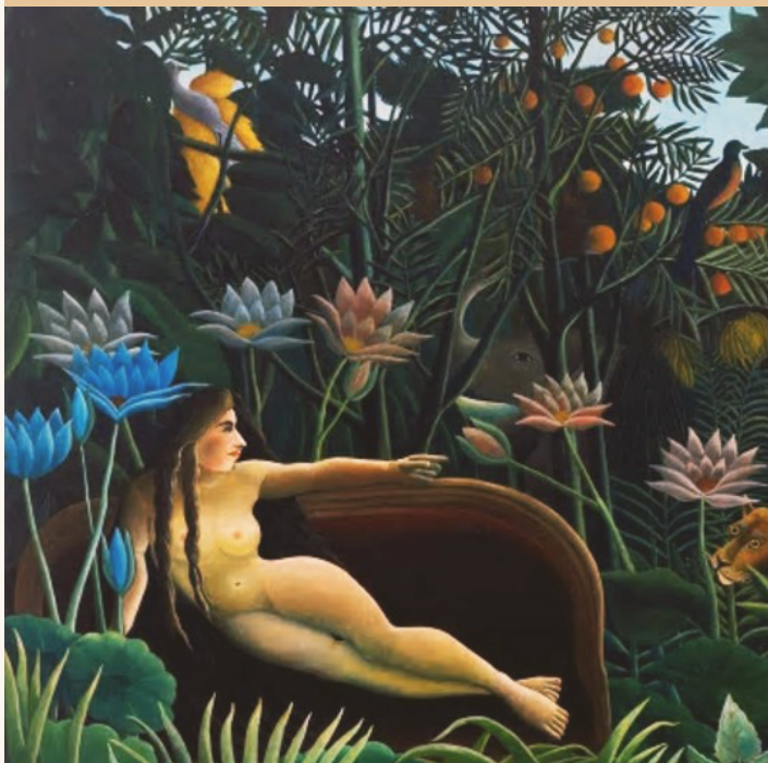
רוסו, פרט מתוך: חלום בארקדיה, 1910