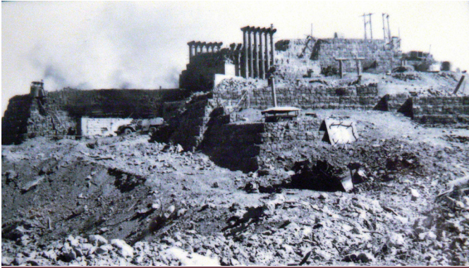
צילום מוצב החרמון במוזאון גולני

לעשות. לא המלצתי וזו הייתה טעות ענקית. הייתי צריך להגיד ישר 'בטח! תן לו צל"ש! הוא בא לטפל בי והוא לא היה חייב לעשות את זה. הוא היה יכול לברוח אבל הוא בא אליי ונהרג עליי, אז ברור שמגיע לו צל"ש'. זו הייתה טעות קשה, שעד היום אני נושא איתי".