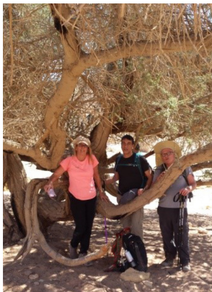
עץ שיטה בנחל מעוק