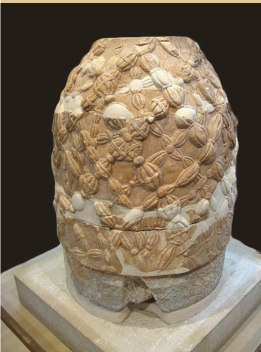
אומפאלוס, מוזיאון דלפי, התקופה ההלניסטית