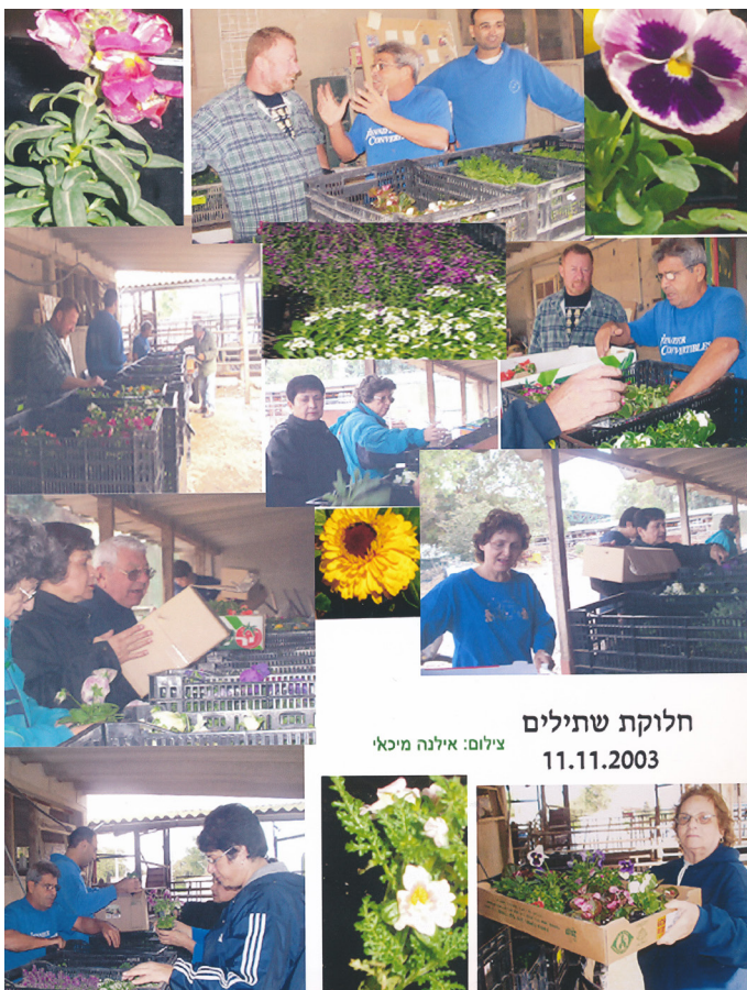
חלוקת שתילים 11.11.2003

לסיכום: - חשוב מאד שהחברים יכינו את גינותיהם לפני החלוקה. נבעיקר שיחכנו, מה הם רוצים וכמה שתילים