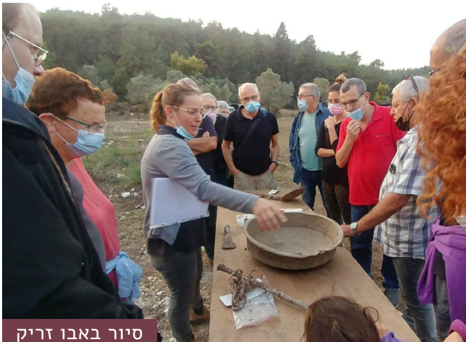
סיור באבו זריק