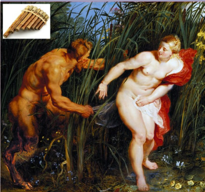
רובנס, [פרט מתוך] פֶּאן וסִירִינְקֶס, 1625