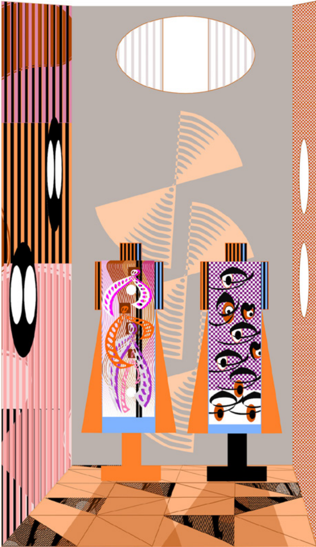
נורית דוד, טוקונומה B2, הדפסה דיגיטלית פיגמנטית ארכיונית על בד, 2016

הזדמנות מצויינת לעזור לנו להגיע ליעד הנדרש לצורך שיקום תצוגת הקבע והתאוששות מהגניבה שאירעה באוגוסט האחרון, וזה גם מוכר לצרכי מס!