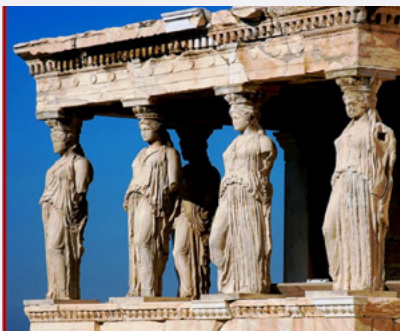
הקריאטידות במרפסת הארכתאון, אתונה, המאה ה-5 לפנה"ס