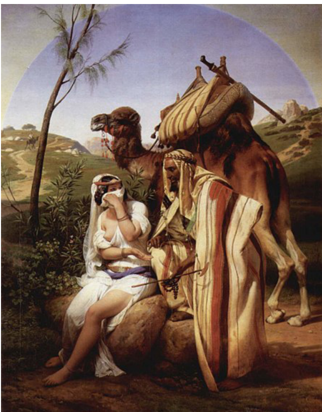
יהודה ותמר, ציור של הוראס ורנה משנת 1840

יעקב נפרד מאיתנו, גם יוסף ואחיו, ומופיע משה. ספר שמות נפתח בפרשת שמות המתארת את המהפך הנוראי שחל בבני ישראל שהפכו לעבדים, מצבם הכלכלי, החברתי והדמוגרפי הידרדר פלאים. ואז נחתה הבשורה הכי גרועה שתיתכן: כל-הבן הילוד, היארה תשליכהו, וכל-הבת, תחנין.