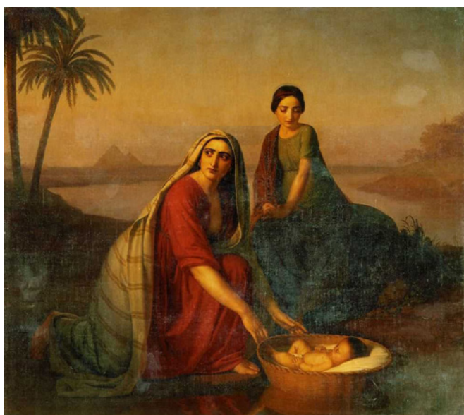
"אם משה", ציור שמן מאת אלכסיי טיראנוב, 1842.

וזו שעתן הגדולה של הנשים, גיבורות הפרשה. הן לא ממהרות להשליך תינוקות עבריים ליאור. לא ולא.