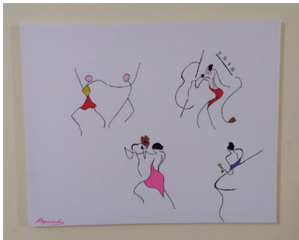
ציור: ריימונד אליס. Happy New Year 2021.