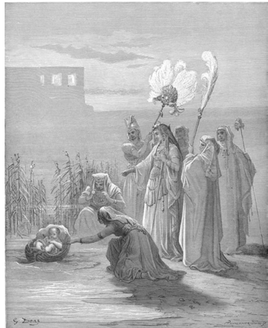
משה בתיבה ובת פרעה והפמליה שלה, בתחריט של גוסטב דורה מ-1886

טו ויאמר מלך מצרים, למיילדת העברית, אשר שם האחת שפרה, ושם השנית פועה. א,טז ויאמר, בילדכן את-העבריות, וראיתן, על-האבנים: אם-בן הוא והמתן אותו, ואם-בת הוא וחייה. א,יז ותיראן המיילדת, את-האלהים, ולא עשו, כאשר דבר אליהן מלך מצרים; ותחיינן, את-הילדים. א,יח ויקרא מלך-מצרים, למיילדת, ויאמר להן, מדוע עשיתן הדבר הזה; ותחיינן, את-הילדים. א,יט ותאמרן המיילדת אל-פרעה, כי לא כנשים המצרית העברית: כי-חיות הנה, בטרם תבוא אלהן המיילדת וילדו. א,כ וייטב אלהים, למיילדת; וירב העם ויעצמו, מאד.