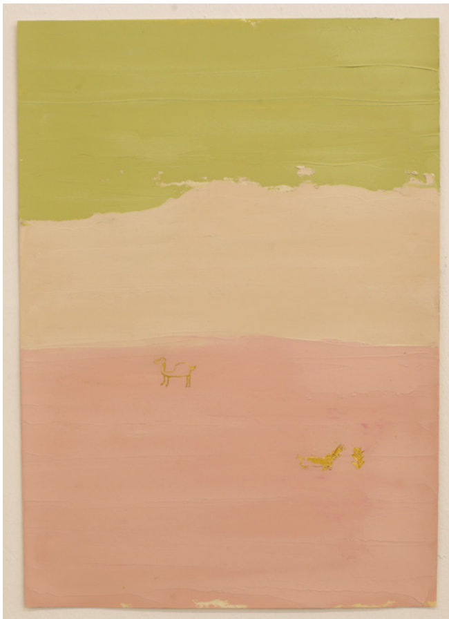
אלהם רוקני, A Dog, oil and gold leafs on paper , 2020

הזדמנות מצויינת לעזור לנו להגיע ליעד הנדרש לצורך שיקום תצוגת הקבע והתאוששות מהגניבה שאירעה באוגוסט האחרון, וזה גם מוכר לצרכי מס!