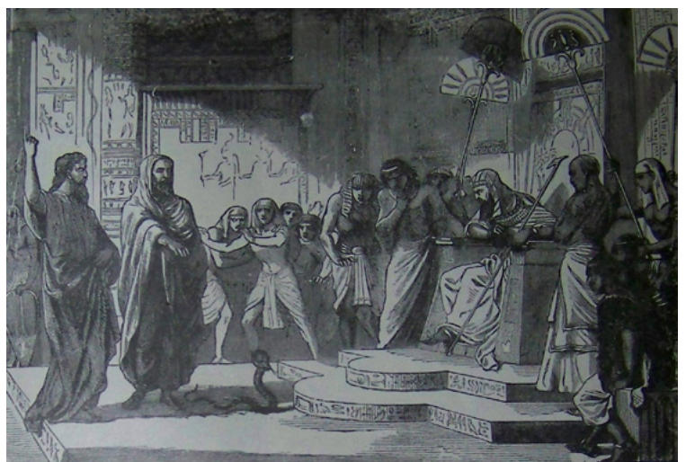
משה ואהרן ניצבים בפני פרעה ואנשיו, איור מתנ"ך הולמן משנת 1890

אנו מצויים בספר שמות. בני ישראל במצרים, עבדים בתנאים הגרועים ביותר שביתן לתאר. כדי להוציאם מעבדות לחירות, יש להעמיד להם מנהיג בעל שיעור קומה, וגם להכשיר את הלבבות למסע של חיייהם, למשימה הגדולה בתולדות העם, שטרם נולד. משה, שסיפור חייו שונה ומיוחד מיום לידתו, קורץ מחומר של מנהיגים. לא כמו שאנו מכירים כיום: הוא אינו נהנתן, אינו עוסק בענייני הפרטיים וכל כולו לענייני הציבור שעליו הוא מופקד, בצניעות ובענווה. הוא אינו מתהדר בנוצות לא לו, לא מהסס להיעזר באחיו אהרון, כדי להתגבר על ליקוי בדיבור ("ערל שפתיים", "כבד פה וכבד לשון"). בקיצור – רועה צאן שהפך רועה לעמו. ומשה נבחר על ידי אלוהים (וכל אחד יפרש את אלוהים לפי הבנתו ואמונתו) להוציא את בני ישראל ממצרים, ולהפוך אותם מאוסף שבטים לעם. חתיכת משימה. כדי להוציא את בני ישראל ממצרים, צריך לשכנע את פרעה, מלך מצרים, לשחרר אותם מעבדותם.