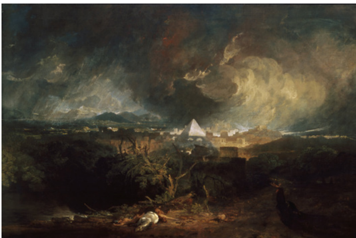
The Fifth Plague of Egypt, J. M. W. Turner, 1800