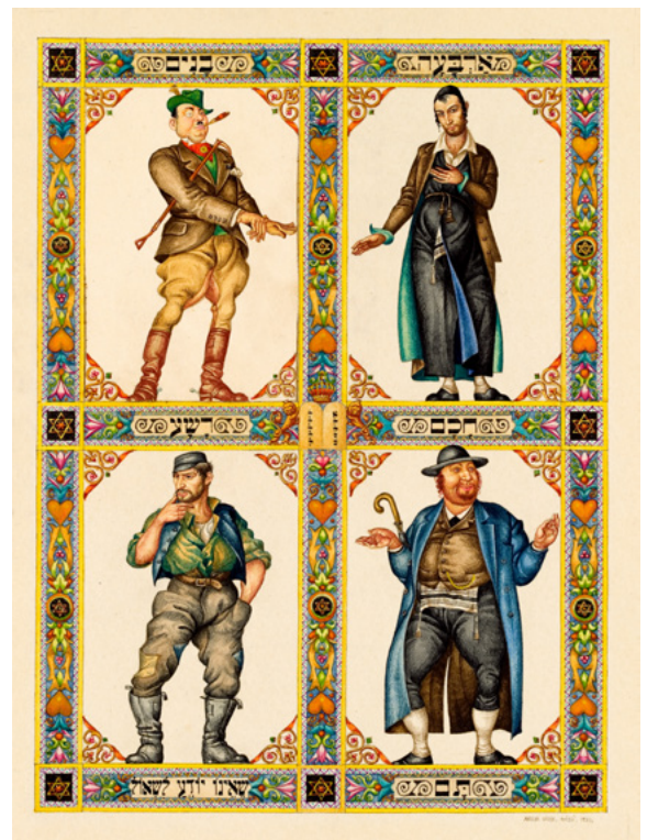
עיבוד מודרני מתוך הגדת שיק מאת ארתור שיק לדמויות ארבעת הבנים, לודז', 1934

יציאת מצרים מודגשת מאד בתורה ובהלכה, כיוון שדרכה בחרו סופרי המקרא להנחיל את האמונה: "וידעתם כי אני ה'".