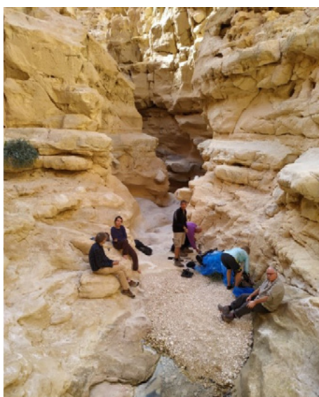
השביליסטים בקניון נחל ברק