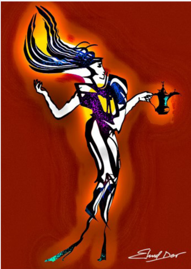
אהוד דור, קירקה מקבלת את פני אודיסאוס