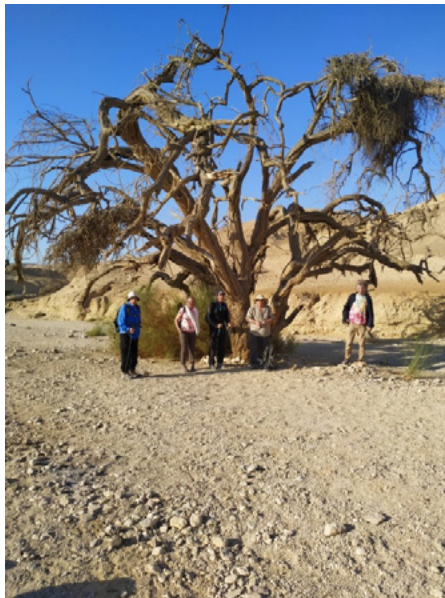
השביליסטים שנחל יטבתה