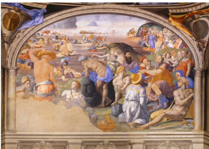
חציית ים סוף, פרסקו מאת אניולו ברונזינו, פאלאצו וקיו, פירנצה

הו, לך ישר לך לבד, אל תפחד. אוהו אוהו או. אל תכעס, לך תמים, לך אחד.