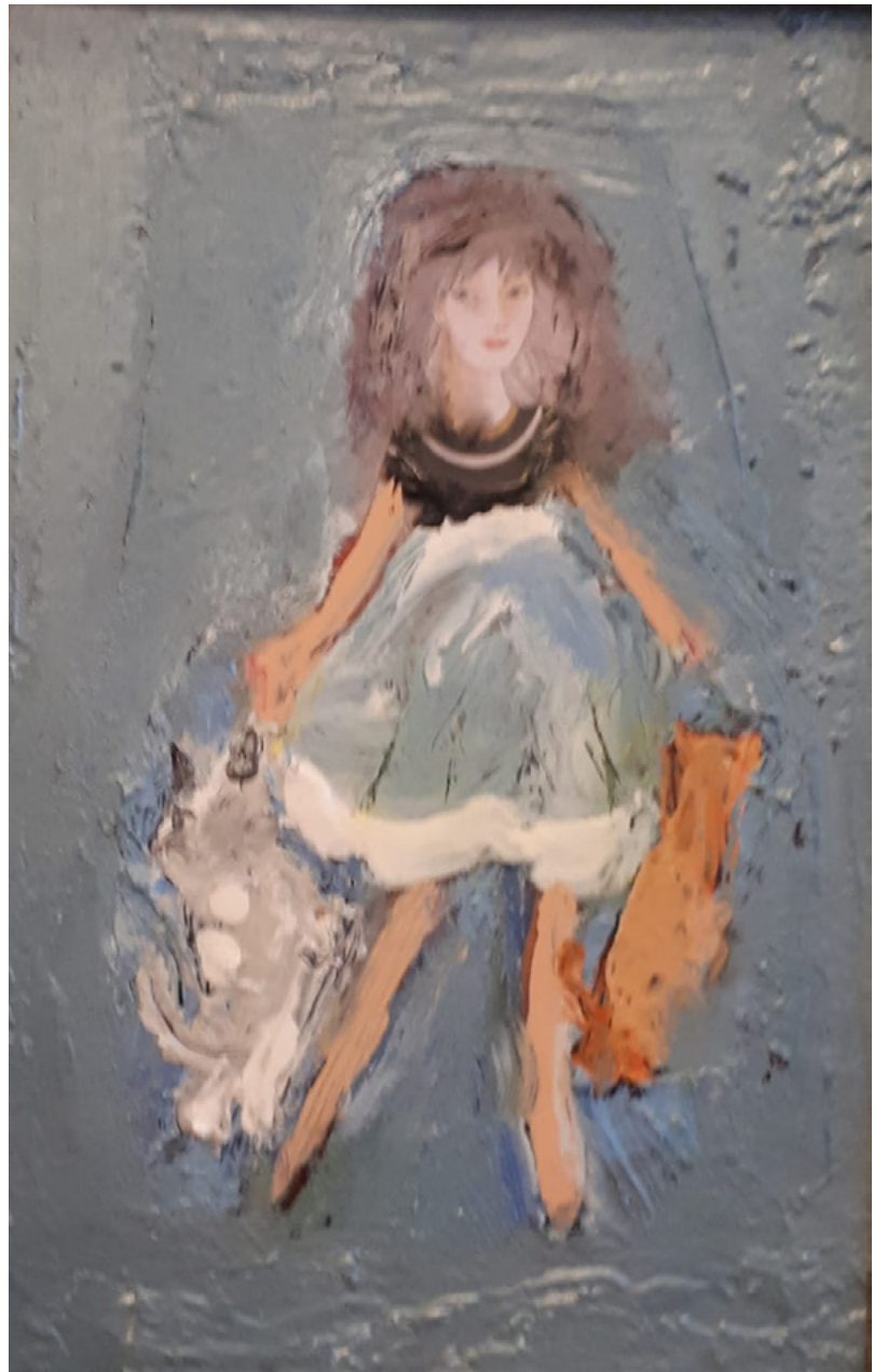
הננדה רוני, איתי מיכאלי